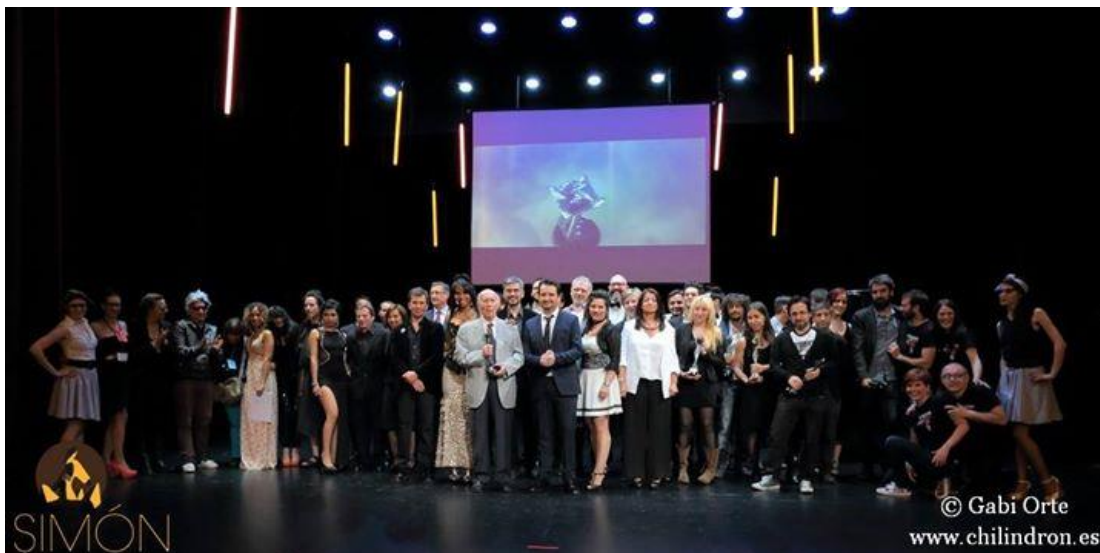
Ganadores y Equipo.

Equipo de los Premios Simón. Academia del Cine Aragonés